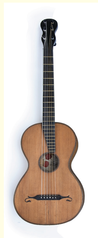
Het type gitaar dat Franz Schubert bespeelde.